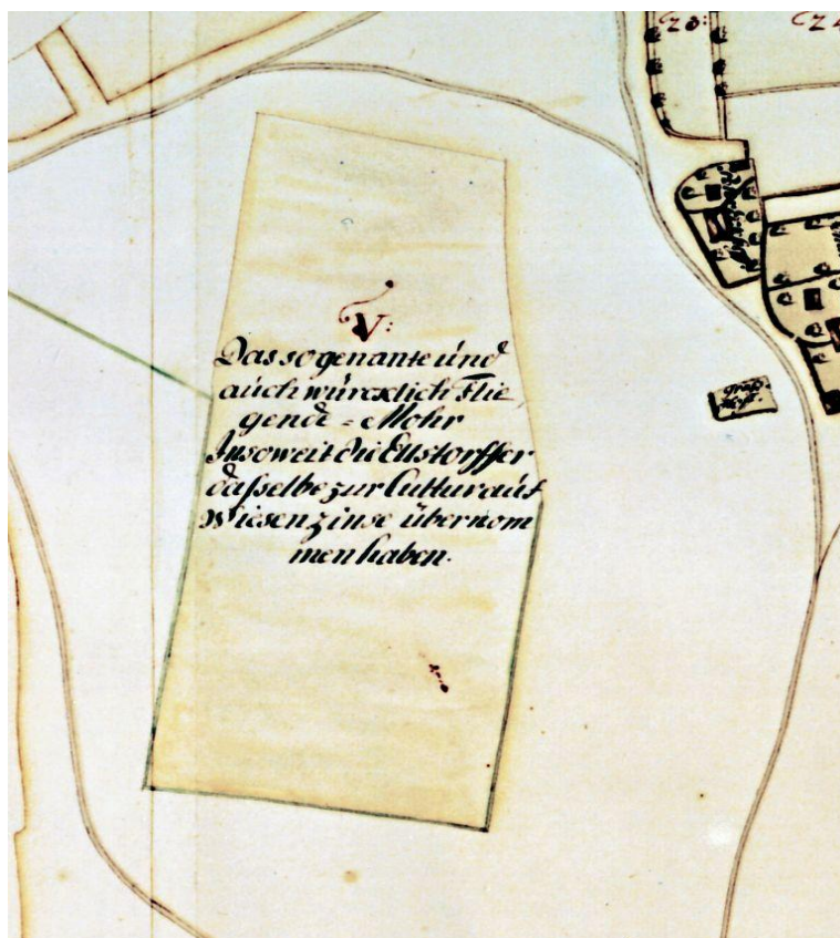
Abb. 5: Vergöberung aus der obigen Karte. Nutzung als Wiese!